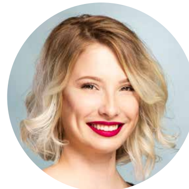
Merle Hribar Postproduktion Kommunikationsdesign