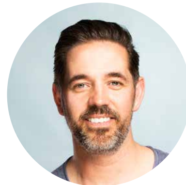
Chris Ermke Inhaber Fotografie

www.fashion-fotograf.de info@chrisermkedia.de