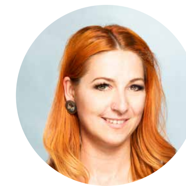
Sarah Gewandt Organisation Fotoassistentz